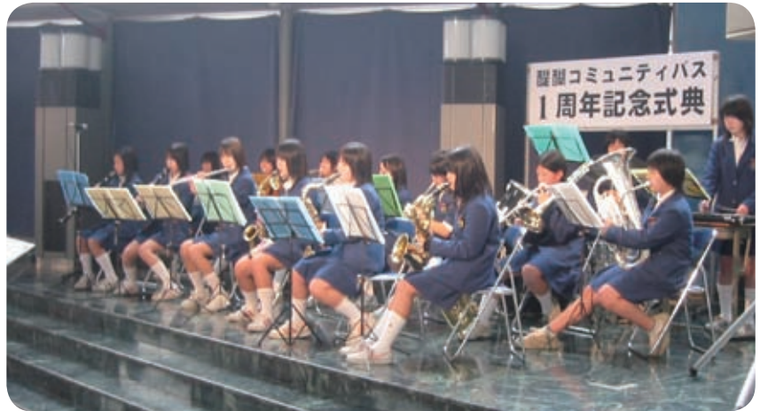
1周年を祝って栗陵中学校吹奏楽部が演奏