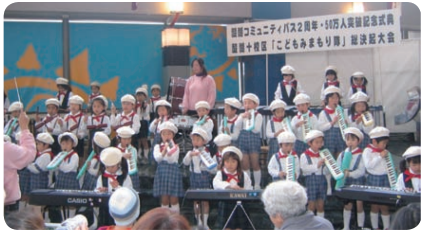
運行開始2周年・50万人突破を祝って端山保育園児による演奏