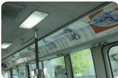
「動くバスギャラリー」は力作を乗せて走った

▼平成 21 年 2 月 運行開始 5 周年記念式典及び記念 イベント開催 オリジナルストラップ販売開始