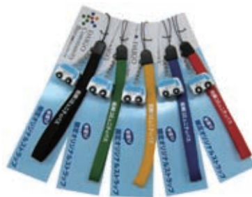
5 周年は 5 色のストラップを特注し販売