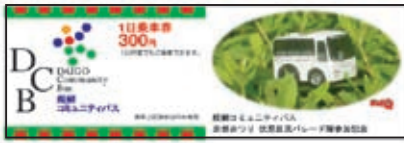
醍醐コミュニティバス 京都まつり 伏見区民パレード参加記念乗車券