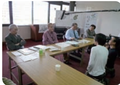
NHK の取材を緊張して受ける役員の皆さん

▼平成 21 年 7 月 NHK 総合テレビ「いよっ日本ー！ 一度は乗ってみたい路線バス」で全 国に紹介