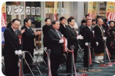
醍醐駅前の停留所でテープカットにより運行開始