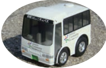
「コミュバス版チヨロQ」の人気は高かった