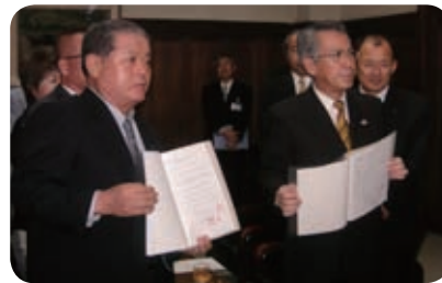
敬老乗車証・福祉乗車証の適用調印式