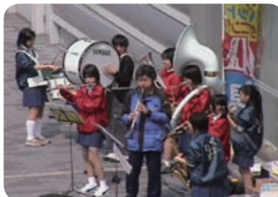
小栗栖中学校の生徒・先生がジャズでおもてなし