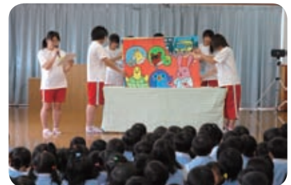
栗陵中学校美術部の生徒さんが制作・初上演（あけぼの保育園にて）