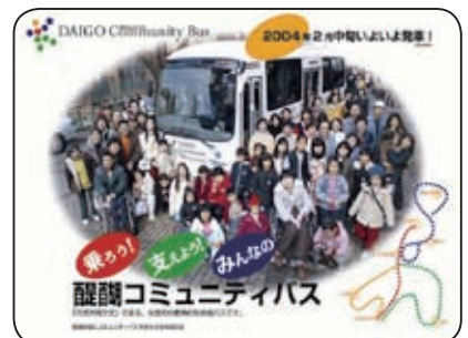
醍醐コミュニティバス最初のポスター