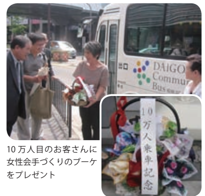
10万人目のお客さんに女性会手づくりのブーケをプレゼント