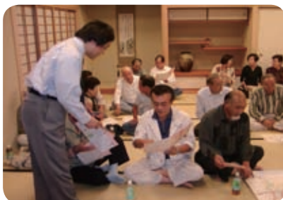
学区毎にきめ細かく説明会を開催した