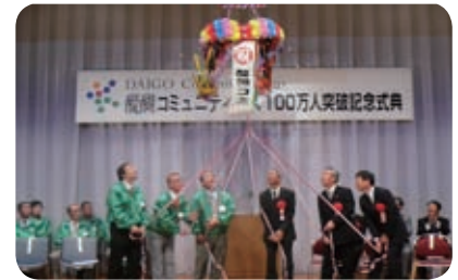
100万人突破記念式典はくす玉割りから