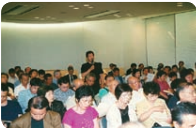
会場一杯になったフォーラムで熱い意見交換が

その後、他都市調査、市交通局などへのバス路線開設の要望活動、市民フォーラムの開催、地域の企業・病院・福祉施設などへの支援依頼、近畿運輸局や山科警察署との協議