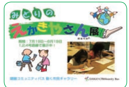
環境学習の成果を「動くバスギャラリー」で展示