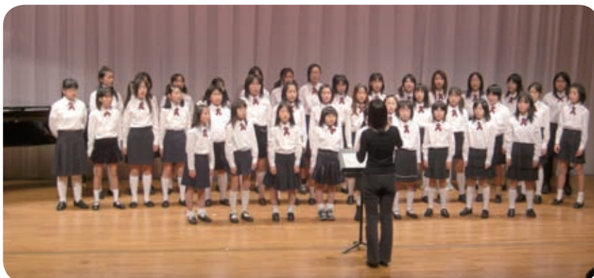
運行開始 5 周年記念イベントでは小栗栖宮山小学校合唱部が美しい歌声で祝福してくれた

▼平成 21 年 2 月 運行開始 5 周年記念式典及び記念 イベント開催 オリジナルストラップ販売開始