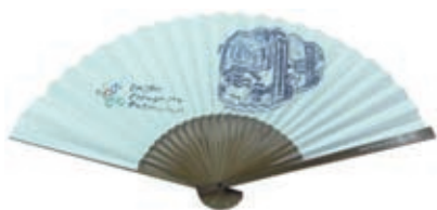
省エネを先取りしたオリジナル扇子を発売