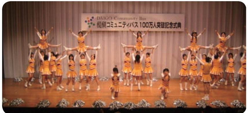
100万人突破記念を祝うイベントには立命館宇治高校チアリーダー部が華麗なる演舞を