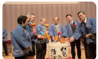
運行 7 周年・利用者 300 万人突破記念は鏡割りで